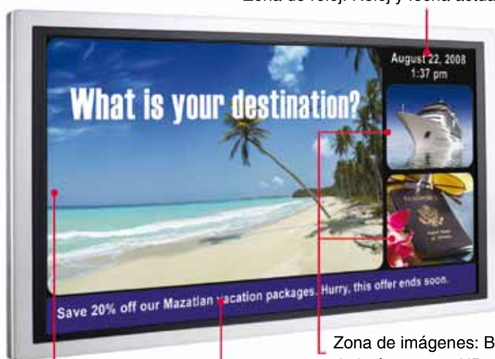
Zona de reloj: Reloj y fecha actual

Zona de Vídeo: Calidad superior de vídeo en HD