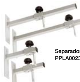
Separadores de pared PPLA0023/25