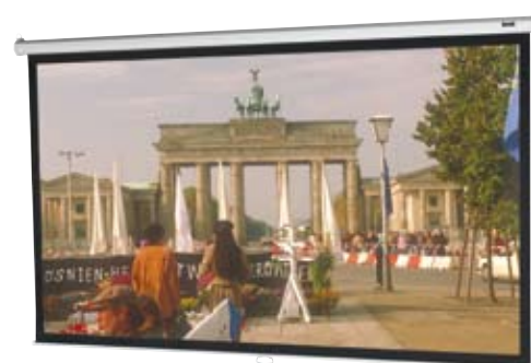
Pantalla manual formato 16:9