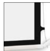
Detalle de esquina