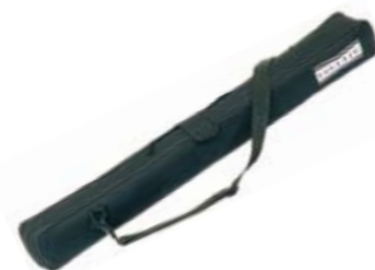
Bolsa de transporte